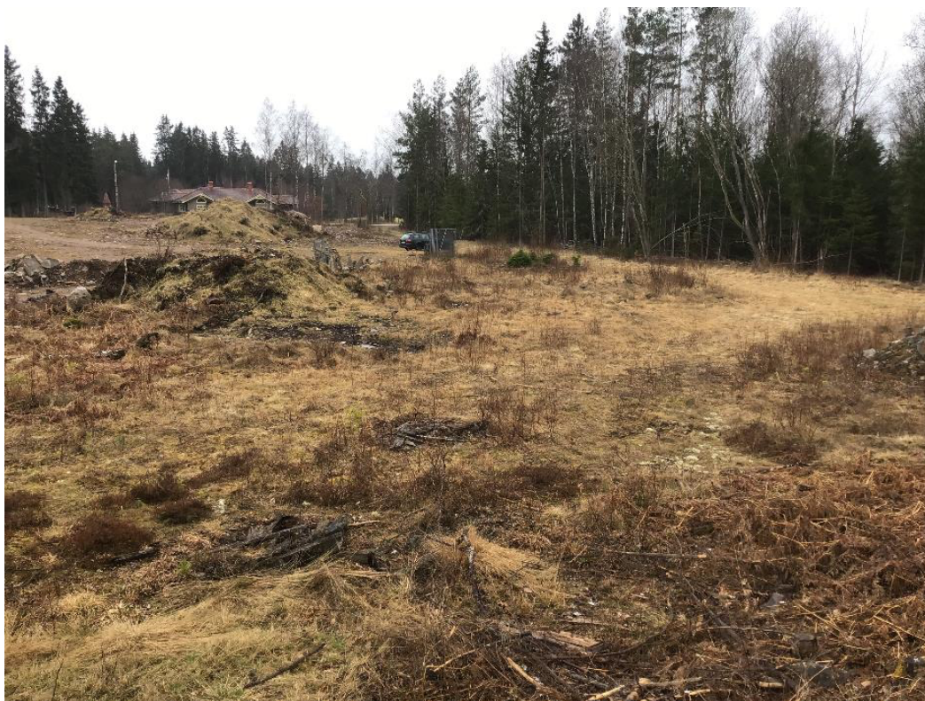
Figur 3. Fastigheten Risinge 1:20 fotad från norr mot söder. Huset längst bort i bilden ligger på södra sidan om vägen som utgör fastighetens södra gräns.

Det är dock möjligt att fladdermöss till och från kan flyga över fastigheten och ibland även jaga där. Fladdermöss rör sig nattetid över stora områden och kan då observeras i en mängd olika miljöer. Men utifrån områdets nuvarande skick finns inget som tyder på att platsen skulle vara bättre jaktmark än det övriga omgivande landskapet. För att ett område ska vara en god födosökmiljö för fladdermöss krävs att det finns en stor tillgång på insekter. Normalt utgörs typiska födosökmiljöer av våtmarker, sjöar, åar, sumpskogar, trädbärande betesmarker, parkmiljöer och andra insektsrika miljöer. Sådana naturtyper saknas inom Risinge 1:20.