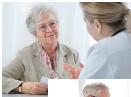
Det här fotot a licensieras enligt