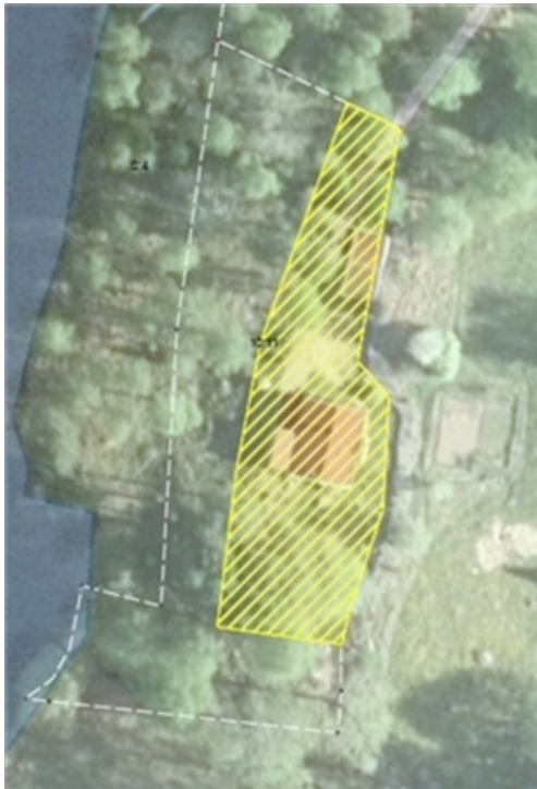
Tomtplatsavgränsning, sammanlagt cirka 970 kvm.

Som särskilt skäl anges att området redan har tagits i anspråk på ett sätt som gör att det saknar betydelse för strandskyddets syften, enligt 7 kapitlet § 18c p1 Miljöbalken.