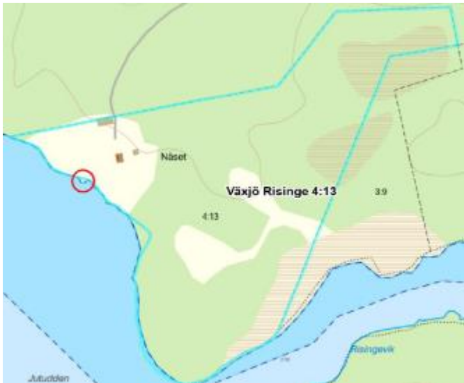
Utdrag ur Lantmäteriets "Min karta"

Båda dessa rekvisit anser miljö- och byggnämnden är tillämpbara. Området är ianspråktaget sedan innan strandskyddet tillkom och på platsen är det sedan gammalt gjort en utfyllnad i sjön. Tyvärr kan man inte visa det med flygfoto, men det sägs också ha funnits en brygga där tidigare. Anläggningen som ansökan gäller, en flytbrygga på 2 x 5 meter, måste ju ligga i vattnet för att funktionen skall finnas. Placeringen av bryggan är lämplig just där tomten når ner till vattnet och det finns en gammal utfyllnad ut i sjön.